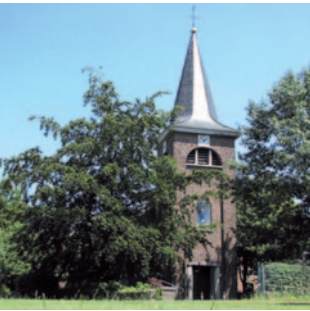
St. Mariä Himmelfahrt Rickelrath