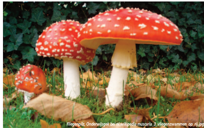
Fliegenpilz

„Sie hat Krieg und Verfolgung überlebt, den Verlust der Familie, die Zeit im Untergrund und das Konzentrationslager Theresienstadt. Ihre Kraft und ihren Lebensmut hat Margot Friedländer, 102 Jahre alt, dennoch niemals verloren. Noch heute hält die Zeitzeugin an ihrem Ziel fest: „Ich spreche für die, die es nicht geschafft haben. Dass ich es geschafft habe, überlebt habe, verpflichtet mich“, schildert sie in ihrem Buch „Ich tue es für euch“ (München 2021). Es gibt viele Beispiele von