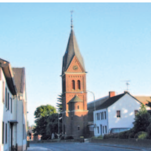
St. Johann Baptist Wildenrath