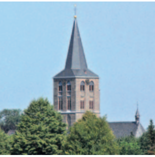
St. Vincentius Beeck