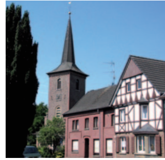
St. Rochus Rath-Anhoven

Mo 01.04. 08:00 Ostermontag · Wortgottesfeier So 07.04. 08:00 Wortgottesfeier f. d. Gemeinde Di 16.04. 17:30 Hl. Messe So 21.04. 08:00 Wortgottesfeier f.d. Gemeinde So 05.05. 08:00 Wortgottesfeier für d. Gemeinde