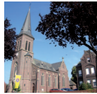
Zur Heiligen Familie Klinkum

zugunsten der Opfer des Erdbebens in Syrien & Türkei und den Opfern der Kriege in der Ukraine und Israel am 28. April 2024 um 17:00 Uhr in St. Vincentius Beek s. auch Seite 6