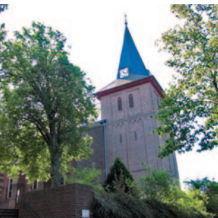
St. Peter und Paul Wegberg