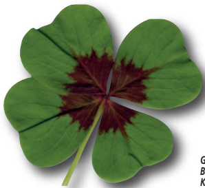
Glückslee. Bild: Benutzer: Kolossos, 2005

M it Beginn des Frühjahres wächst auch in uns die Sehnsucht nach Glück.