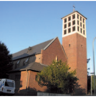
St. Rochus Dalheim